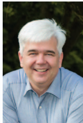
Timo Zentgraf Bürgermeister

Wir wünschen viel Spaß beim Entdecken der Möglichkeiten in unserer jungen, sympathischen Gemeinde.