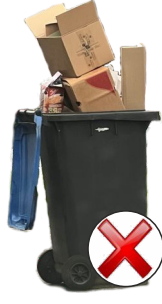
Leerung nicht möglich.

Grundsätzlich werden nur Abfallmengen mitgenommen, die in die Restmüll-, Altpapier-, Bio- oder Gelbe Tonne passen. Die Tonnen dürfen nur so befüllt sein, dass die Deckel noch schließen . Aus überquellenden Tonnen können sonst Gegenstände bei der Leerung herausfallen, Straße und Gehweg verschmutzen, parkende Fahrzeuge oder andere Gegenstände beschädigen und sogar Personen verletzen. Abfälle dürfen nicht in die Müllgefäße gepresst oder gestampft werden, da sie sonst nur teilweise oder gar nicht geleert werden können. Bei erfolgloser oder unvollständiger Leerung (z.B. wegen gefrorenen oder eingestampften Abfällen) besteht kein Anspruch auf eine erneute Leerung oder eine Gebührenminderung.