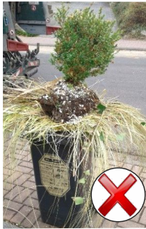
Leerung nicht möglich.

Grundsätzlich werden nur Abfallmengen mitgenommen, die in die Restmüll-, Altpapier-, Bio- oder Gelbe Tonne passen. Die Tonnen dürfen nur so befüllt sein, dass die Deckel noch schließen . Aus überquellenden Tonnen können sonst Gegenstände bei der Leerung herausfallen, Straße und Gehweg verschmutzen, parkende Fahrzeuge oder andere Gegenstände beschädigen und sogar Personen verletzen. Abfälle dürfen nicht in die Müllgefäße gepresst oder gestampft werden, da sie sonst nur teilweise oder gar nicht geleert werden können. Bei erfolgloser oder unvollständiger Leerung (z.B. wegen gefrorenen oder eingestampften Abfällen) besteht kein Anspruch auf eine erneute Leerung oder eine Gebührenminderung.