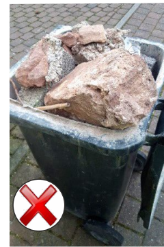
Fehlbefüllt und viel zu schwer - großes Sicherheitsrisiko -

Mülltonnen sind nicht grenzenlos belastbar. Eine 120-Liter-Tonne ist nur bis zu einem Höchstgewicht von 60 Kilogramm, eine 240-Liter-Tonne bis 110 Kilogramm von den Herstellern zugelassen. Wird der Inhalt beispielsweise stark verdichtet oder werden Bauschutt, Steine und Erde eingefüllt, wird das Gewicht oft weit überschritten. In der Bio-Tonne führen insbesondere große Mengen Fallobst zu Gewichtsproblemen.