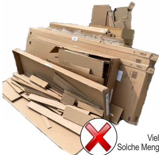
Viel zu viel für die Abfuhr! Solche Mengen werden nicht mitgenommen.

Nutzen Sie das Volumen der Altpapiertonne aus und zerkleinern Sie Kartons und große Verpackungen. Oft sind die Tonnen mit nur einem oder zwei Kartons befüllt und weitere Kartons liegen neben den Tonnen. Diese hätten nach entsprechender Zerkleinerung noch problemlos in das Müllgefäß gepasst. Sie werden deshalb bei der Abfuhr der Altpapiertonnen nicht mitgenommen .