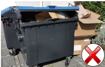
Die Tonne ist fast leer, viele Kartons stehen daneben, die nach Zerkleinerung in die Tonne gepasst hätten.

Besonders beim Altpapier werden oft große Mengen Kartons und Verpackungen zusätzlich zur Abfuhr bereitgestellt. Mitgenommen werden aber nur geringe Mengen. Dazu müssen sie ordentlich in kleinen, leichten (nicht mehr als 10 kg schweren) Päckchen oder Kartons gebündelt sein und mit ein oder zwei Handgriffen schnell aufgeladen werden können ohne auseinanderzufallen. Es ist nicht Aufgabe der Müllabfuhr, einzelne Kartons, Kartonagen oder Zeitungen einzusammeln und einzeln zu verladen. Haushalte können größere Mengen gebührenfrei an den Wertstoffhöfen abgeben. Zerkleinern Sie auch hier größere Kartonagen und Kartons, sonst sind die Container schnell voll, obwohl sie noch viel mehr Altpapier aufnehmen könnten. Andere Anlieferer können dann keine Abfälle mehr abgeben.