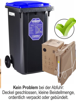
Kein Problem bei der Abfuhr: Deckel geschlossen, kleine Beistellmenge, ordentlich verpackt oder gebündelt.